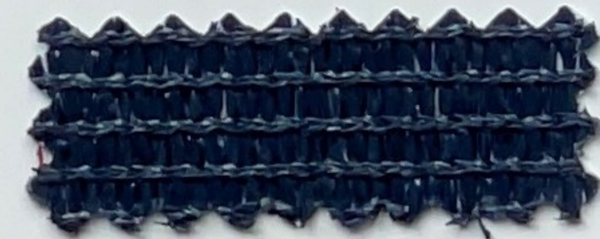
dunkelblau dark blue