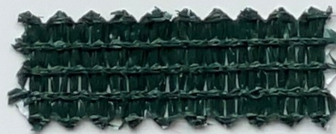
dunkelgrün dark green (200 cm)