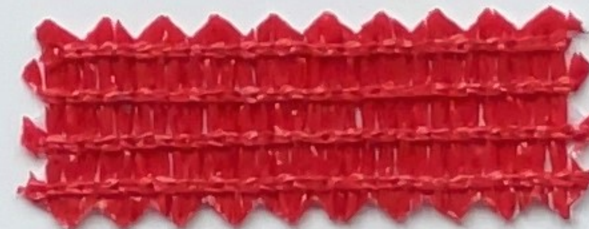
rot red (200 cm)