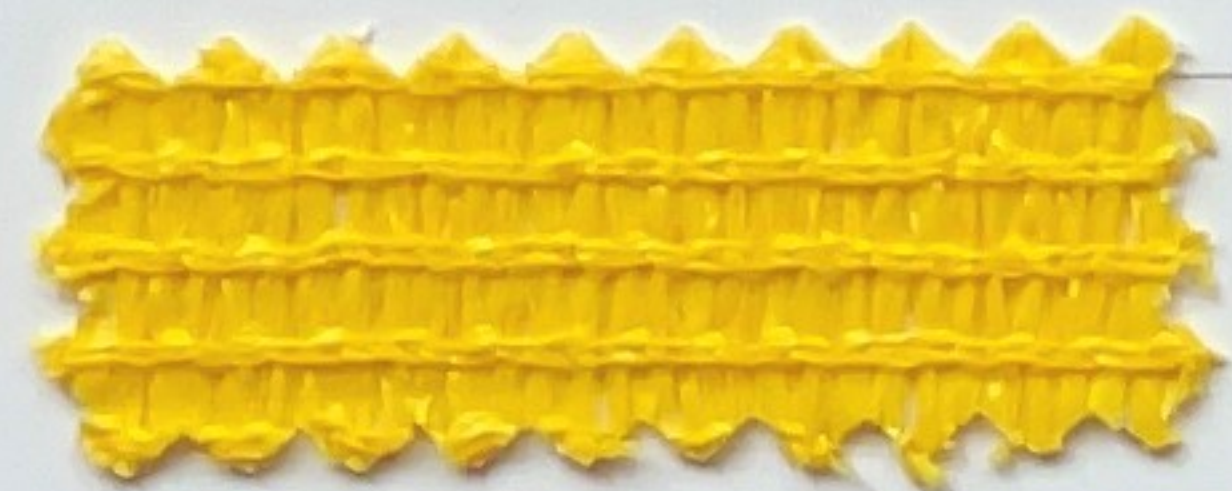
gelb yellow (200 cm)