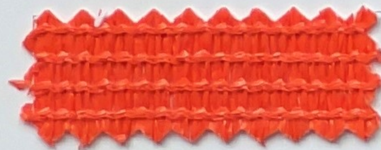
orange (200 cm)